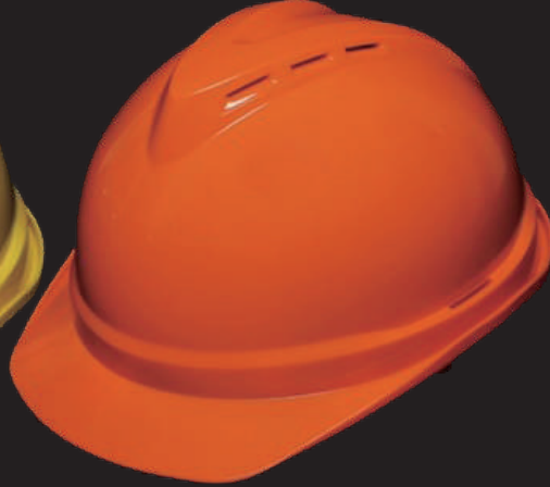
透氣式 V18 材質ABS/V19 材質HDPE