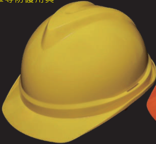
V16 材質ABS/V17 材質HDPE

專利頭帶設計，調整帽圍大小只需單手，頭帶附上簡易解除的藍色按鈕，一指即可簡單調整或拆卸。 調整範圍：53~62cm 微調尺寸可小至0.3cm